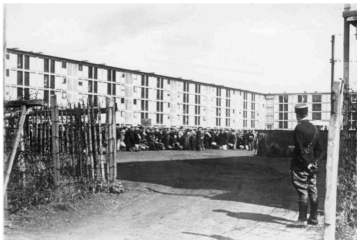
Camp de Drancy

De là, Sarah est emmenée à Drancy, le plus grand camp d'internement puis de transit sur le sol français. Drancy est alors un bâtiment inachevé, imposant, en forme de « U », destiné à l'origine à l'habitation de personnes modestes, haut de quatre étages, desservis par une vingtaine d'escaliers. Le camp, bien gardé par des gendarmes français est entouré d'un chemin de ronde, fermé par une double rangée de barbelés de trois mètres de hauteur, interrompu par des miradors et des postes de garde.