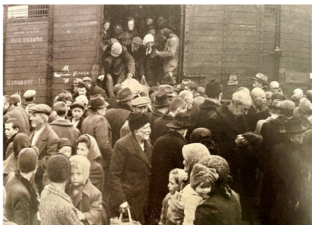
Photo: Arrivée d'un convoi de Hongrie entre mai et juillet 1944

A leur arrivée, le 31 juillet, tous les hommes ont été sélectionnés pour le travail ainsi que 514 femmes. 216 femmes ont été immédiatement gazées. Cinq rescapés de ce convoi sont rentrés en 1945. Sarah n'est pas revenue.