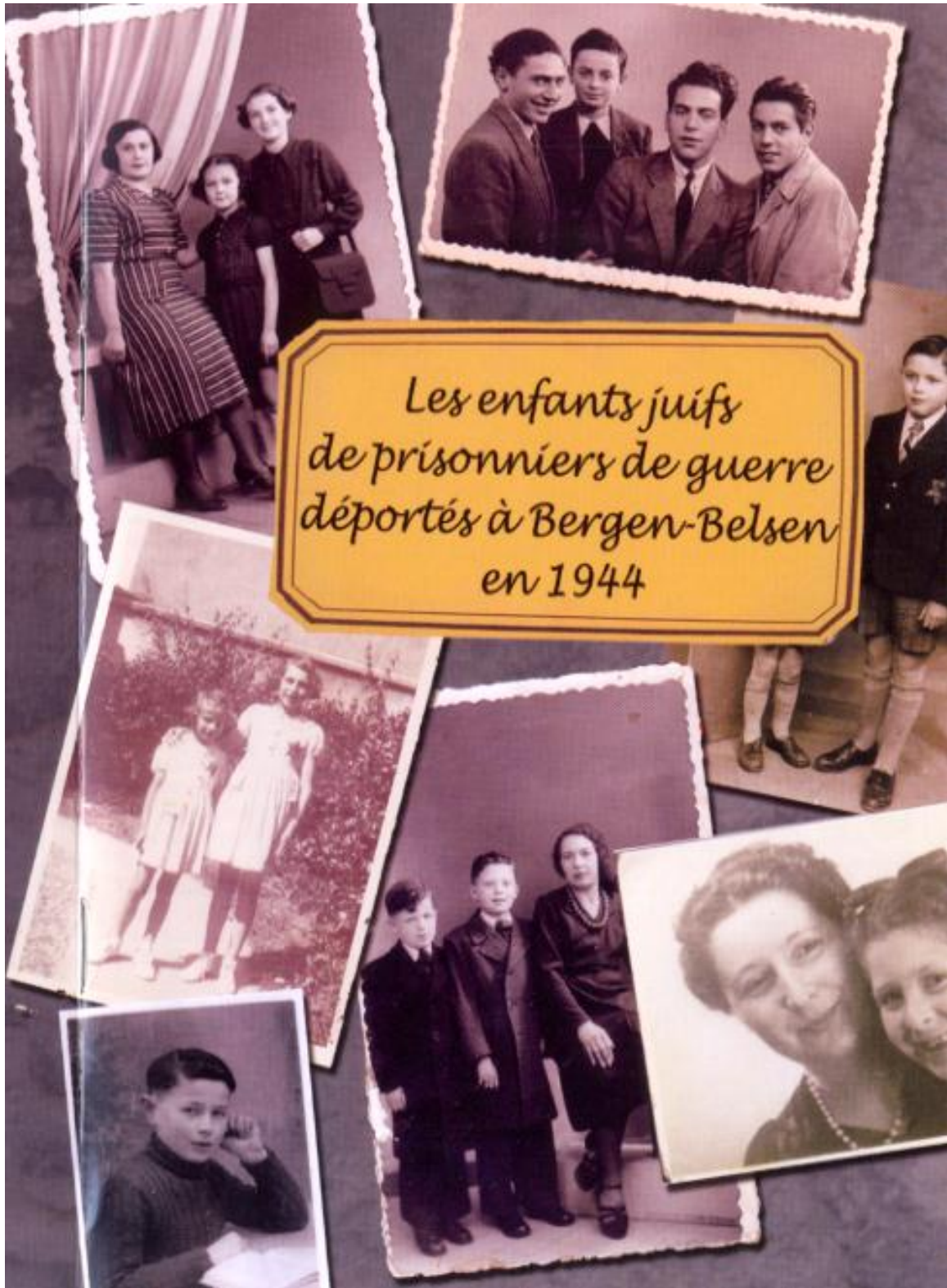
Enfants juifs de prisonniers de guerre, enfants-témoins déportés de France au Camp de l'Etoile à Bergen-Belsen, les 2, 3 mai, 21 et 23 juillet 1944.